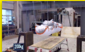
高知県森林技術センター